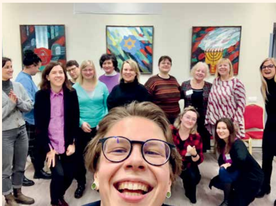
В семинарах приняли участие около 200 учителей и эдукаторов Литвы