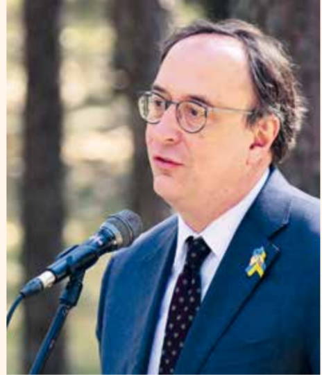
Посол США в Литве Роберт Гилкрист

Бурная реакция литовской и зарубежной общественности и досудебное расследование, начатое прокурорами Вильнюсской окружной прокуратуры в связи с подозрениями на разжигание ненависти и подстрекательство против группы лиц по национальному признаку, не охладил Р. Жемайтйтиса. В середине июня, когда в Литве отмечался День скорби и надежды, посвященный памяти жертв советской депортации в Сибирь, депутат вновь обрушился на евреев, обвинив их в том, что они стали виновниками Холокоста в отношении литовцев.