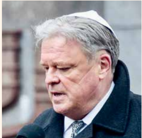
Посол Германии в Литве Маттиас Зонн

Возмущенный высказываниями Жемайтйтиса о евреях, посол Германии Маттиас Зонн также распространил сообщение, в котором назвал слова депутата жестокими и антисемитскими.