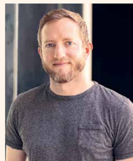
Joe Baur / Фото ВВС

Представьте себе веточки укропа, плавающие в холодном свеколном супе - в холоднике, картофельные клецки с творогом или мясом в холодный зимний день, кусочки черного хлеба, запеченные с чесноком, который вы сами втираете в хлеб. Это одни из главных блюд литовской кухни - сытные мясные и картофельные блюда, которыми можно подкрепиться на весь рабочий день.