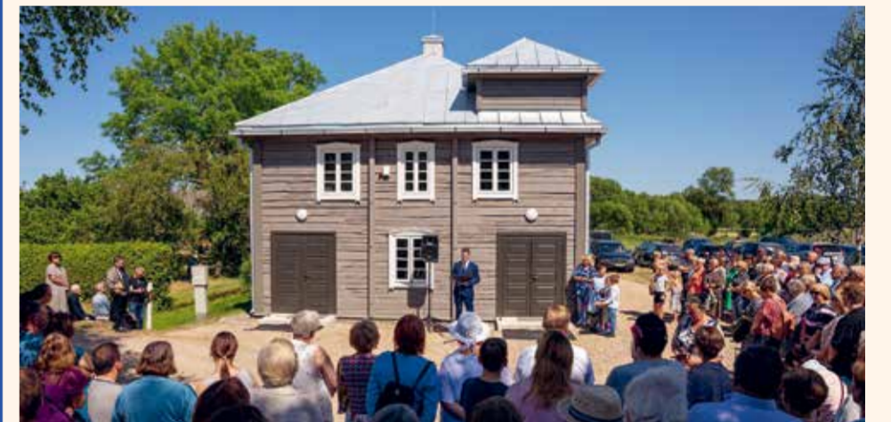
Открытие здания бывшей синагоги в Куркляй

● В этом году исполнилось 75 лет со дня провозглашения независимости Государства Израиль. 14 мая 1948 года еврейские лидеры в Тель-Авиве подписали Декларацию о создании государства Израиль. С тех пор каждый год, на пятый день месяца Ияр по еврейскому календарю, сразу после Йом ха-Зикарон (День памяти павших в войнах и жертв террора), евреи всего мира отмечают восстановление своей исторической родины. По этому случаю Вильнюс сделал подарок Израилю, осветив стиличные мосты и гору Трех Крестов цветами израильского флага, а единственный в Литве ансамбль еврейской песни и танца «Файерлех», существующий уже полвека и ставший легендарным, подготовил специальную программу под названием «Земля обетованная».