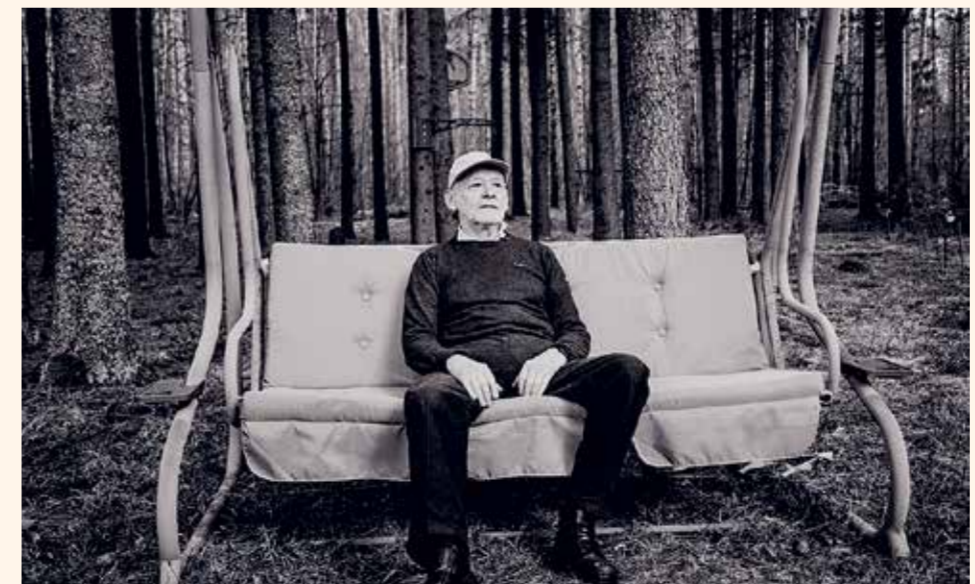
Кадр из видеопортрета проф. И. Парасониса, реж. М. Дриготас

Слово «антисемитизм» в Литве в эти недели ассоциируется с именем одного из членов Сейма. Но это гораздо более серьезная тема, которая останется и после окончания этой позорной кампании.