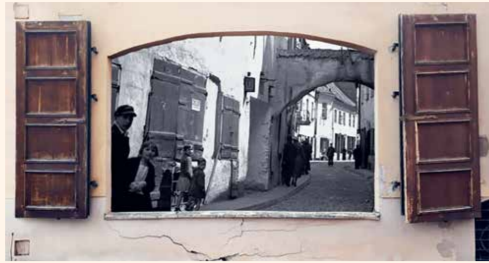
Иллюстрация из календаря «Vilne 700». Авторы – творческая группа JUDVI&AŠ

Идея и дизайн календаря были разработаны творческой группой JUDVI&AŠ.