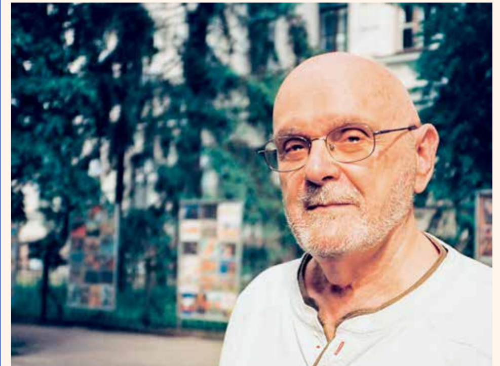
Профессор Саулюс Сужеделис