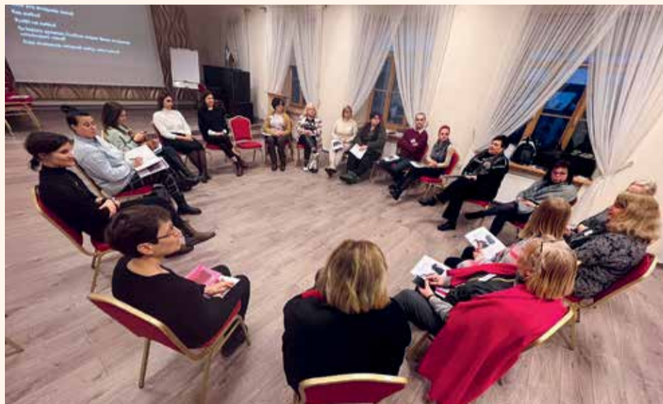
Семинары прошли в шести городах Литвы

лодежных работников. Цель занятий - познакомить их участников с традициями и обычаями общин, живущих по соседству, опровергнуть существующие стереотипы, противостоять антисемитизму и ромофобии. Занятия прошли с большим успехом, в них приняли участие почти 200 человек. Мы не сомневаемся, что программа будет продолжена, так что следите за новостями!