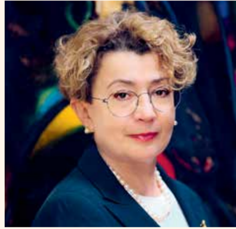
Фаина Куклянски

В начале мая депутат Сейма Литовской Республики Ремигиус Жемайтйтис, не выяснив все факты о снос небезопасного здания школы в Палестинской Автономии, обрушился на Израиль и евреев на своей странице в Facebook. Хотя высказывания депутата вызвали бурю возмущения в обществе, это не остановило его от антисемитских высказываний и сегодня.