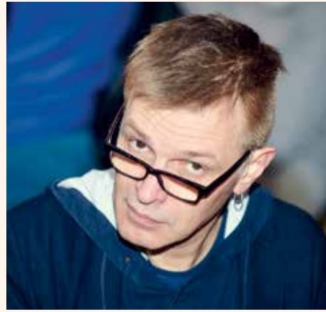
Гинтарас Варнас

Гинтарас Варнас, один из самых известных литовских театральных режиссеров, лауреат Национальной премии в области культуры и искусства и шести «Золотых крестов», очень точно описал сложившуюся ситуацию.