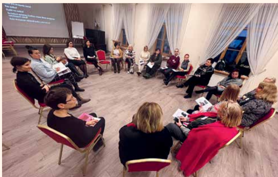
Pažinimo kelionės seminarai vyko net šešiuose Lietuvos miestuose

Mokymai buvo itin sėkmingi, sulaukė beveik 200 dalyvių. Neabejojame, kad programa bus tęsiama ir toliau, tad maloniai kviečiame sekti naujienas!