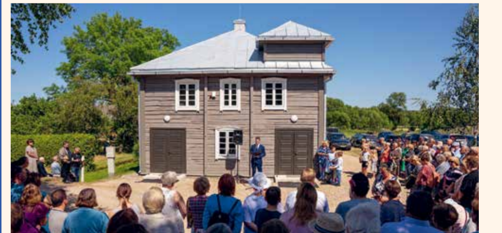
Kurklių sinagogos atidarymo renginys