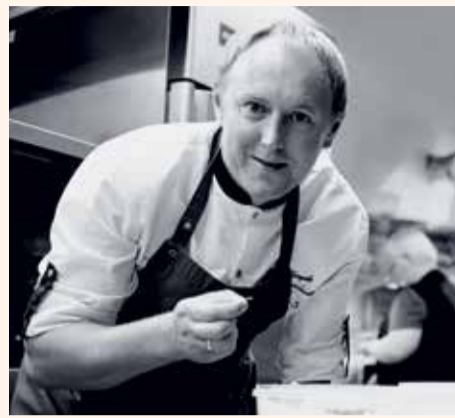
Tomas Rimvydis / R. Danisevičiaus (lrytas.lt) nuotrauka

Šiandien ji mano, kad Vilnius yra viena geriausių vietų pasaulyje valgyti žydišką maistą.