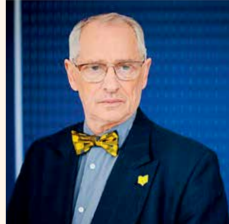
Arkadijus Vinokuras / J. Stacevičiaus / LRT.lt nuotrauka

Šį Seimo nario pareiškimą tai pat smerkė aukščiausi Lietuvos vadovai.