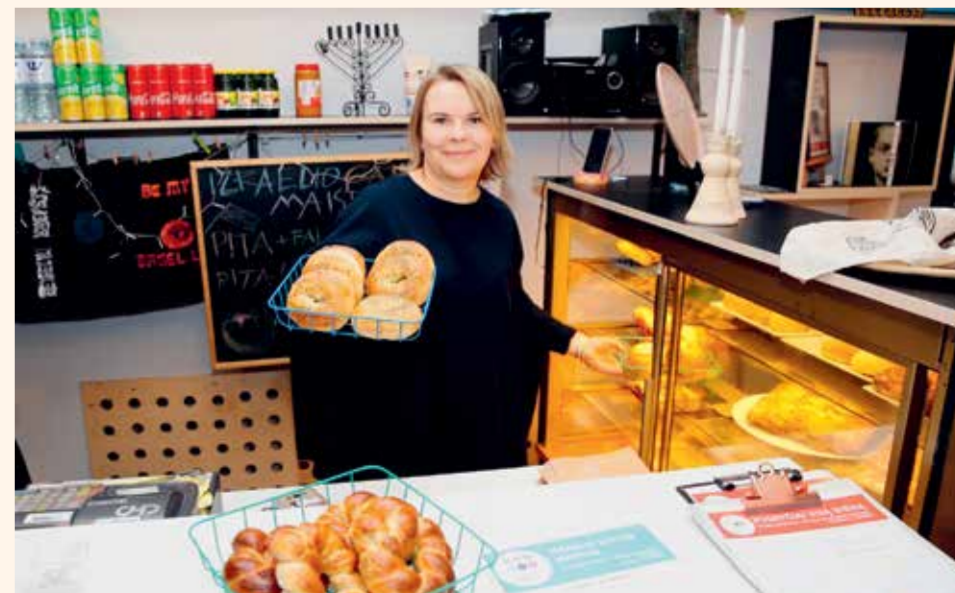
Dovilė Rūkaitė