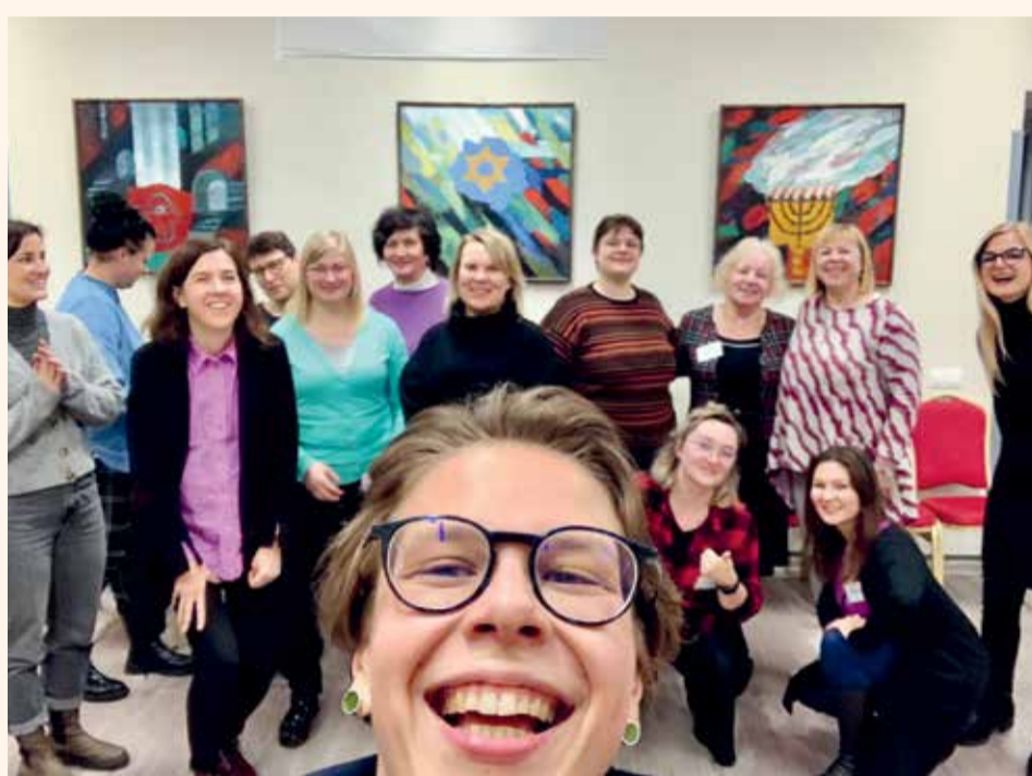
Mokymuose dalyvavo apie 200 Lietuvos mokytojų ir edukatorių