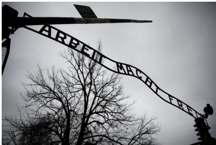
Aušvico koncentracijos stovykla

Tačiau demokratinėje Lenkijoje augo žmonių, nusiteikusių prieš antisemitizmą, skaičius. Jie suprato, kad tai – nuodas, nuodijantis moralę ir sielą. Taip manančių žmonių buvo visame politiniame spektre – nuo kairės iki dešinės.