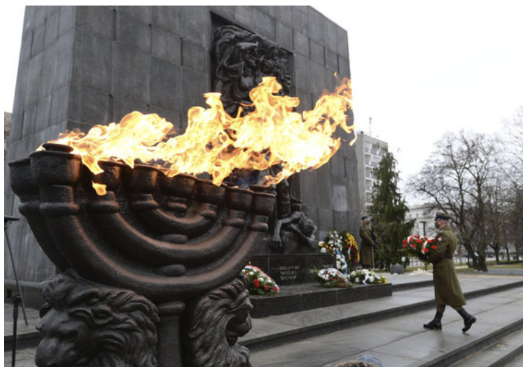
Paminklas Varšuvos geto didvyriams

Šioje istorijoje man svarbiausias aspektas yra tas, kad formaliai istorikus apkaltino moteris iš kaimo Rytų Lenkijoje, tačiau už jos buvo Lenkijos valdančiajai partijai artima organizacija „Lyga prieš šmeižtą“.