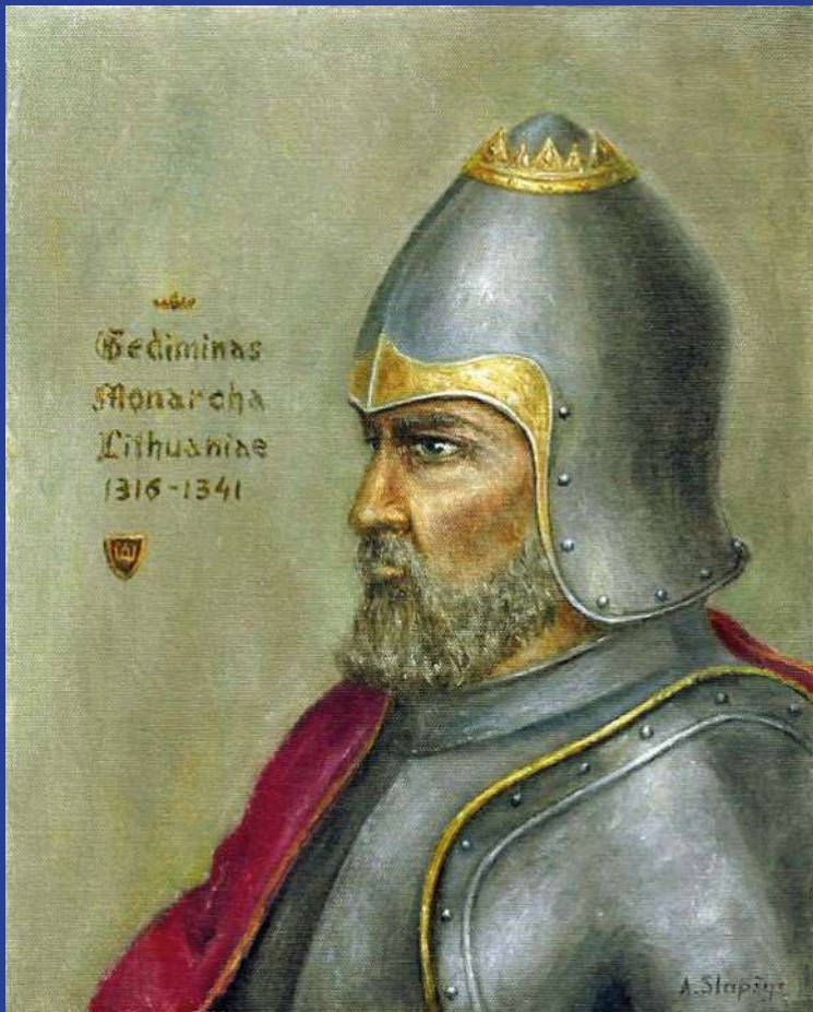
1 paveikslas – Aut. Artūras Slapšys „Gediminas“

Kunigaikštis Gediminas suteikia žydams pirmąsias privilegijas