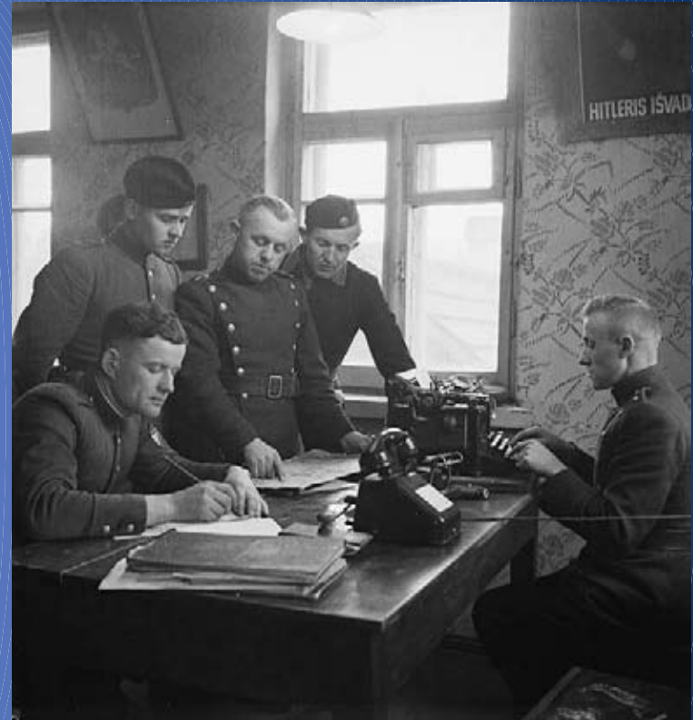
Staff of a Lithuanian Selfdefence Unit in Švenčionys