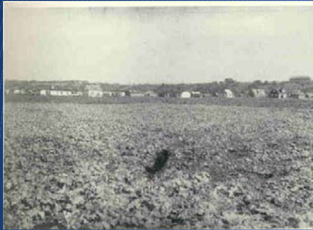
Demokratu aikštė: site of the 'Great action' on October 28th, 1941