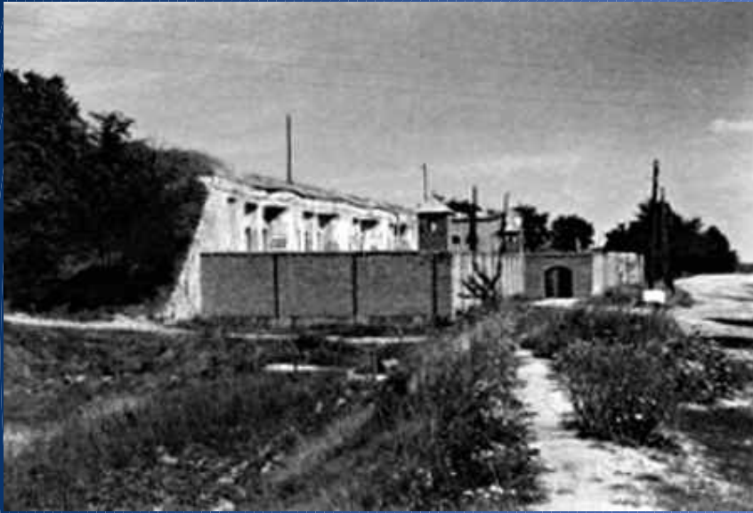
Kaunas Fort IX