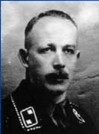
SS-Standartenführer Karl Jäger