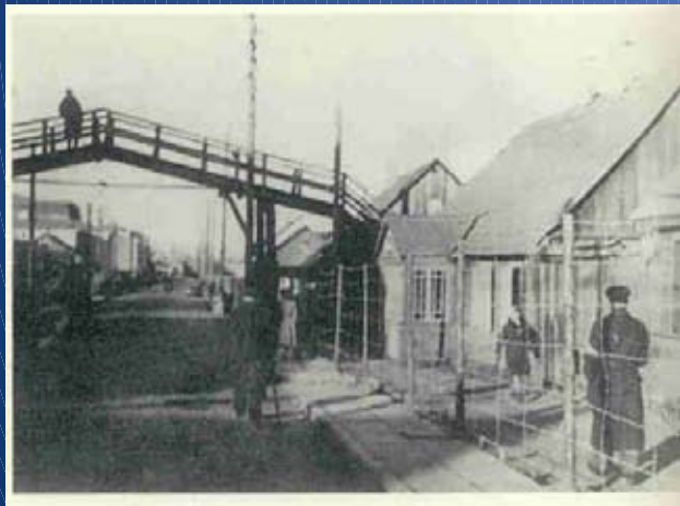
Bridge between the large and the small Ghetto