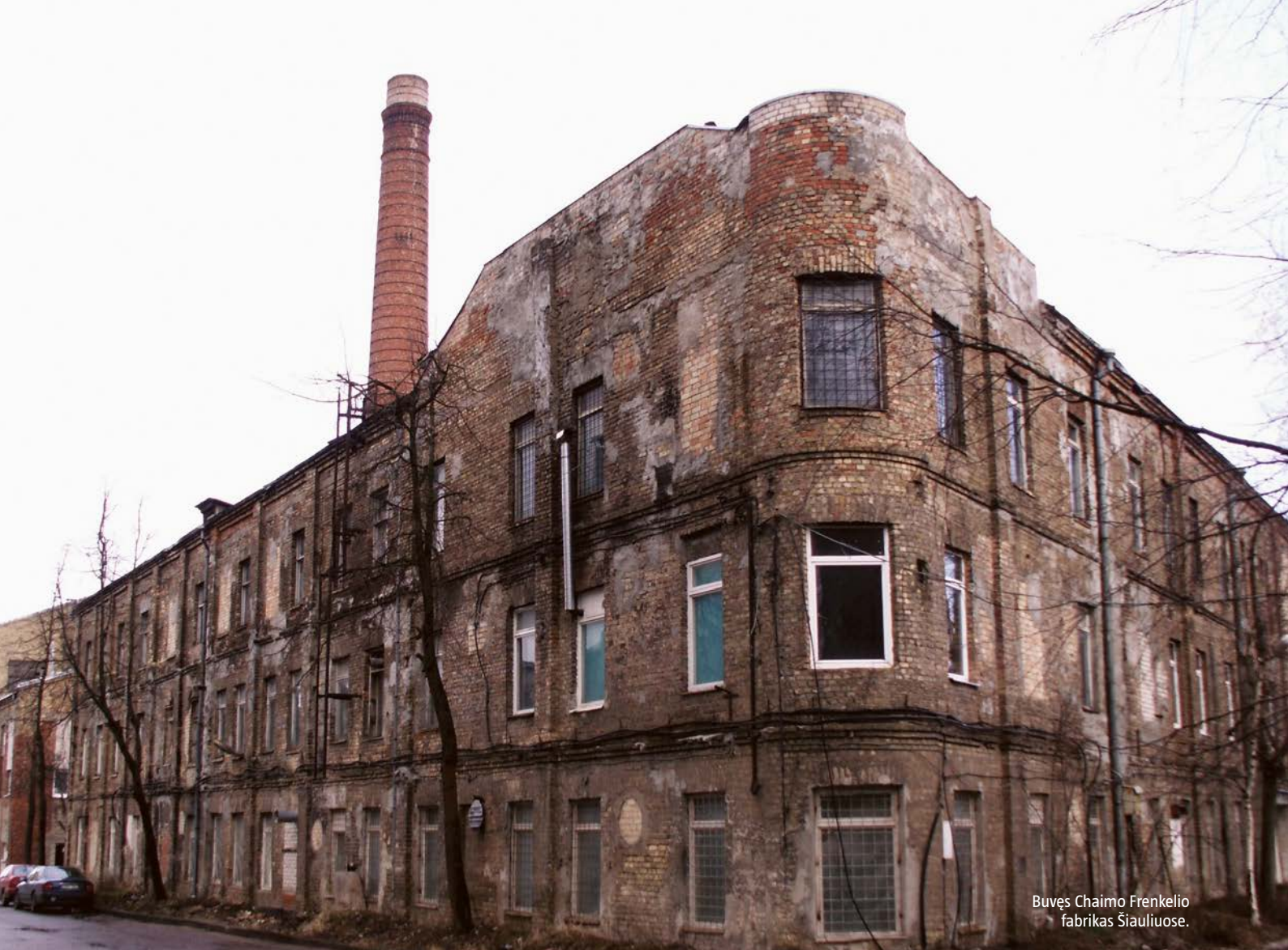
Buęs Chaimo Frenkelio fabrikas Šiauliuose.