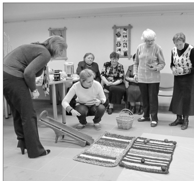
Margučių ridenimo varžybos.