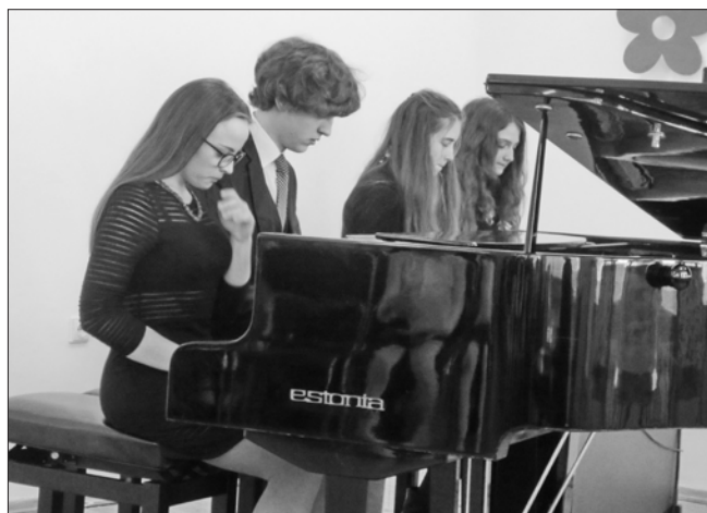
Groja svečiai iš Nemenčinės.