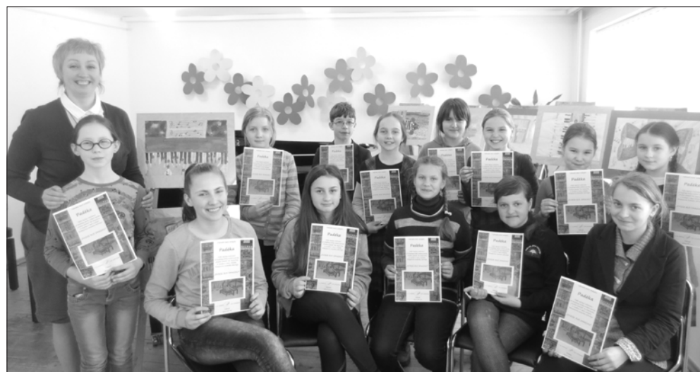
Parodos „Muzikos pasaulis“ dalyviai.