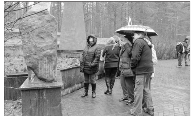
Atminimo akmenukai, gėlės, žvakelės ir maldos už tūkstančius čia galvas padėjusių žydų...