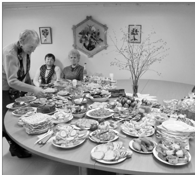
Vaišių stalas visų suneštas su meile.