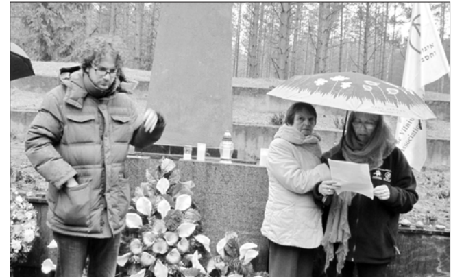
Daugelis šių žmonių čia buvo pirmą kartą, tačiau jie prisimena, kas atsitiko jų tėvams, seneliams ir artimiesiems.