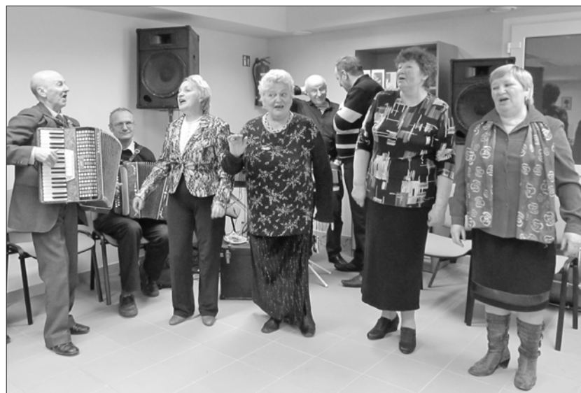
Prie pabradiškių dainininkių prisijungė ir švenčionėliškės.